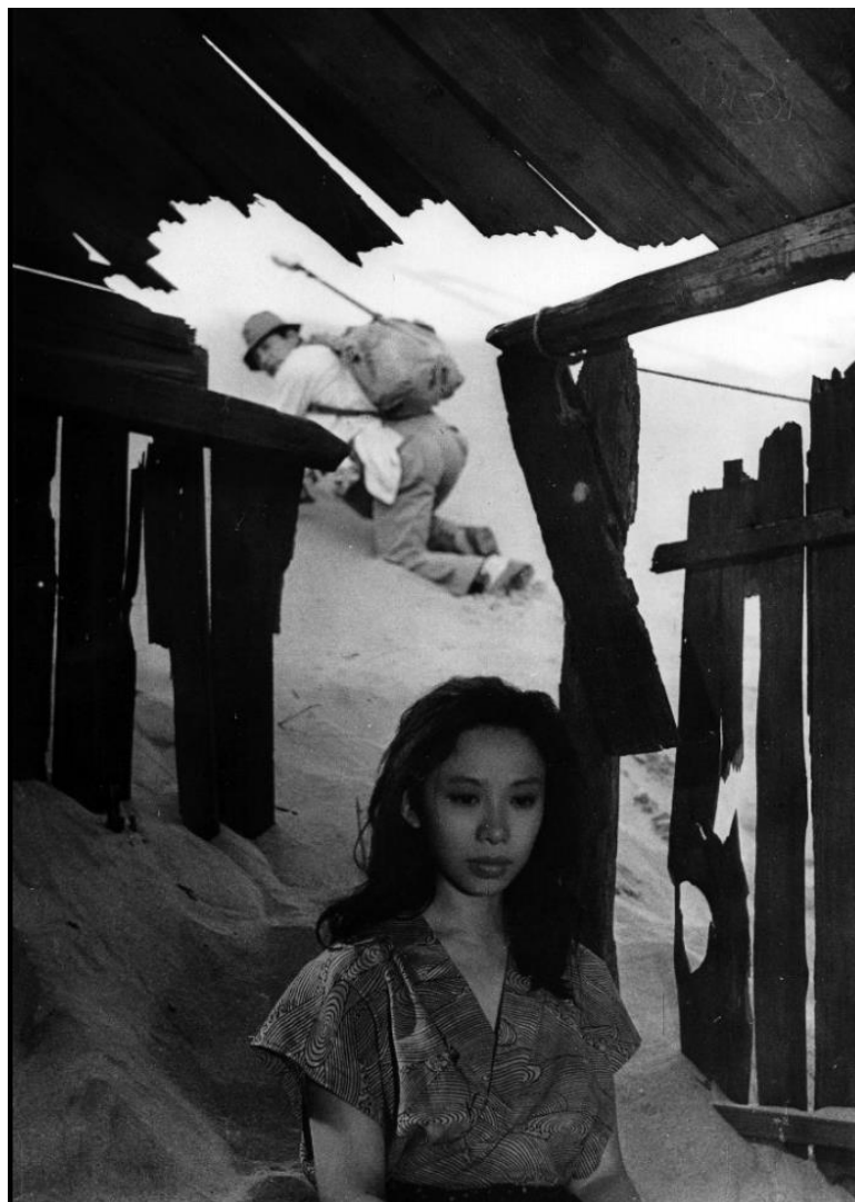
Mynd 2. Eiji Okada og Kyôko Kishida í „Suna no onna“

Sögupráður bókarinnar „Suna no onna“ og samnefndrar myndar: Jumpei Niki kennari frá Tókýó er staddur í nágrenni við afskekkt þorp við sjávarsíðuna í þeim tilgangi að safna skordýrum úr fjörunni. Degi er tekið að halla og hann gleymir tímanum og missir af síðustu áætlunarferð til Tókýó. Innfæddir þorpsbúar bjóðast til að útvega honum gistingu og hann þiggur það. Gistingin er á heimili ungrar konu og húsið hennar er í botninum á djúpri sandgryfju og þangað er einungis hægt að fara með því að ganga niður langan kaðalstiga. Um kvöldið kemst hann að því að unga konan er ekkja, eiginmaður hennar og dóttir fórust í sandstormi og lík þeirra hafa ekki fundist. Næsta morgun þegar Niki æltar að yfirgefa húsið, þá er búið að fjarlægja stigan og hann kemst ekki í burtu úr sandgryfjunni. Stiginn hefur verið dreginn upp úr sandgryfjunni og engum er fært að klifra upp sandveggi gryfjunnar. Sjá mynd 2 af Niki og konunni í sandinum. 6