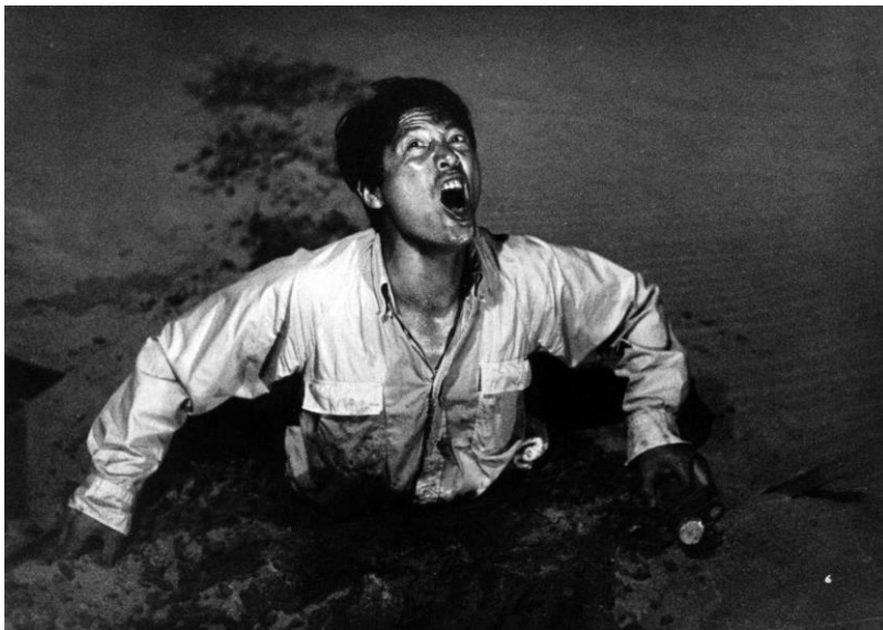
Mynd 3. Eiji Okada „Suna no onna“

Niki reynir nokkrum sinnum að flýja aðstæður sínar en tekst það ekki. Hann komst einu sinni uppúr sandgryfjunni en villtist í sandflæminu umhverfis gryfjuna og lenti í kviksyndi. Þorpsbúar bjarga honum og fara með hann aftur í gryfjuna til ekkjunnar. Sjá mynd 3 af Niki í kviksyndinu. 7