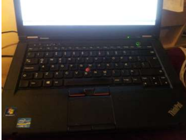
Mynd 2. Fartölvu með ýmsum lógóum.

Trúlega er hægt að segja að grafískir hönnuðir séu of færir í að setja fram boðskapinn sem þeim er ætlað að kynna, ég tala nú ekki um þegar með í verkum eru sálfræðingar sem vita hvernig hægt er að hafa sem mest áhrif og textahöfundar sem kunna að orða boðskapinn. Því flest liggjum fið kylliflöt fyrir áhrifamætti grafískrar hönnunar.