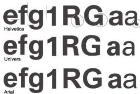
Mynd 3. Munurinn á leturgerðunum Helvetica, Univers og Arial. 6

Þessi munur kemur vel fram á mynd 3 sem einnig er fengin á síðu Emils H. Valgeirssonar.