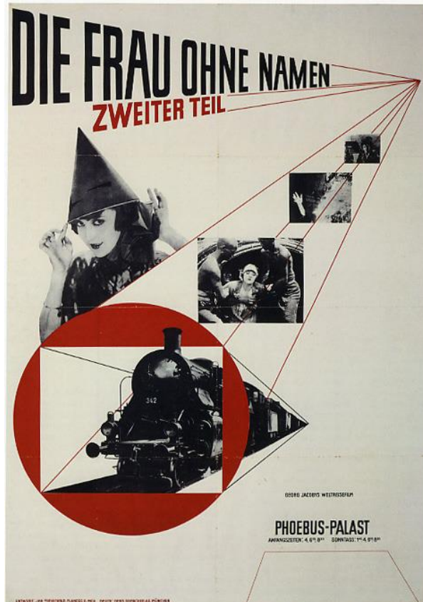
Die Frau ohne namen, veggspjald gert af Jan Tschichold árið 1927 2 .

Veggspjaldið gerði Jan Tschichold árið 1927 til að kynna kvikmyndina „ Die Frau ohne Namen, Zweiter Teil “. Þetta var auglýsing fyrir kvikmyndahús í München, sem þá var stærsta kvikmyndahús Þýskalands. Stærð veggspjaldsins er 123.8 x 86.3 cm og það er unnið með litógrafíu 1 .