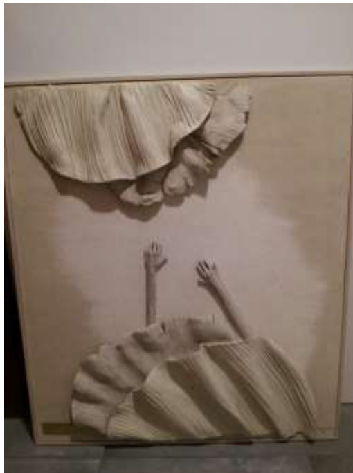
Leirlistaverkið fallega þar sem það er í geymslu.

Annað verkið sem ég valdi er mynd gerð úr leir. Ég veit ekki á þessari stundu hver gerði það, en ég mun komast að því áður en langt um líður. Þetta fallega verk hefur fangað athygli mína síðan ég sá það fyrst og til greina kemur að það verði hengt upp inni á skrifstofu minni. Þar fær verkið þá birtu sem það þarf til að það njóti sín betur en það gerði á dimmum gangi áður. Ég tók af því mynd þar sem það er í geymslu núna, en ég mun taka mynd af því aftur þegar það verður komið upp á réttan stað og þá get ég fjallað nánar um stærð þess, eftir hvern það er og hvenær það var gert. Í huga mínum eru að verða til hugmyndir um pólitískt inntak verksins. Nánar um það síðar.