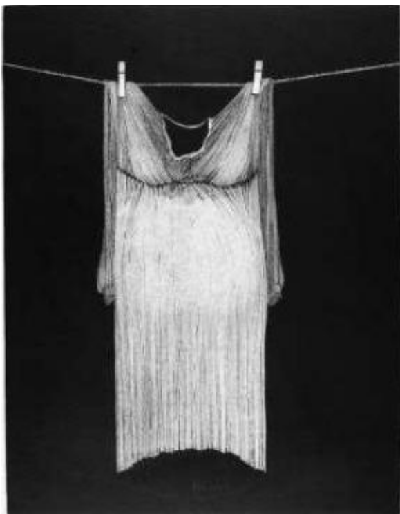
Verk án titils, 1976