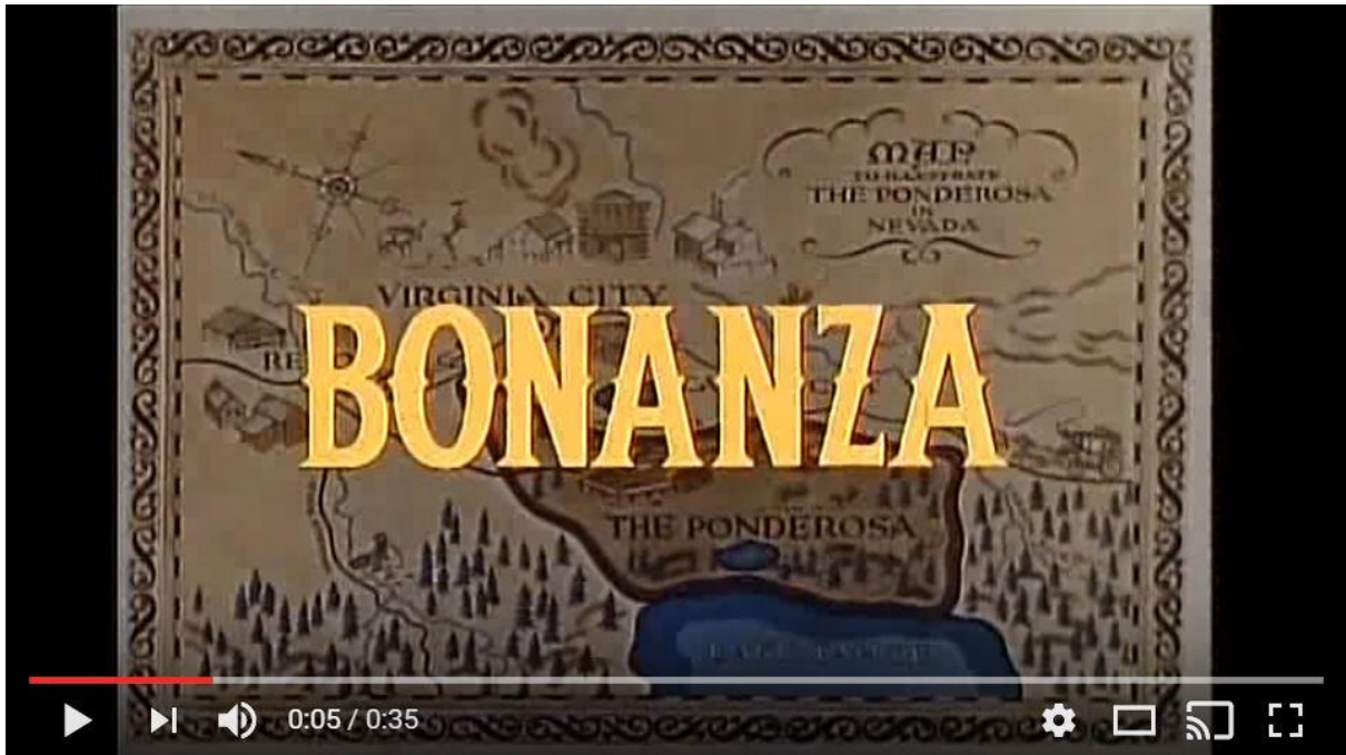
Mynd 1. Kynningarmynd sjónvarpsseríunnar Bonanza

Allir í mínum menningar afkima á þessum tíma vissu að Ben Cartwright var bóndi á búgarðinum Ponderosa og að hann bjó þar með þremur uppkomnum sonum sínum, þeim Adam, Hoss og Litla-Jóa. Þetta var nautgripabúgarður og nær allt líf þessara manna snerist um skepnurnar. Þeir þurftu að reka þær frá einu vatnsbólum að öðru og frá einum bithaganum í annan. Þeir fóru um á hestum og hestamennskan var þeim í blóð borin. Stundum áttu þeir í erjum við nágranna sína varðandi nýtingu á bithögum og vatnsbólum, en öll deilumál leystust alltaf farsællega á endanum. Aldrei kom fram hvort þeir bræður hefðu einhvern tímann átt móður, enda skipti það svo sem engu máli. Konur komu varla fyrir í þessum þáttum... nema þá í mínum unga huga því þar var til staðar yngsta barnið hans Bens sem var stúlkan María og hún var sko fremri þeim öllum í hesta- og smalamennskunni.