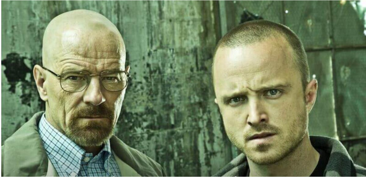
Mynd 3. Félagarnir úr Breaking Bad , þeir Walter White og Jesse Pinkman

White við framleiðsluna og síðan að markaðssetja hana og selja. Sjá mynd 3 af þeim félögum 5 . Fjölmargar aðrar persónur koma við sögu sem eru ekki síður áhugaverðar en aðalpersónurnar tvær.