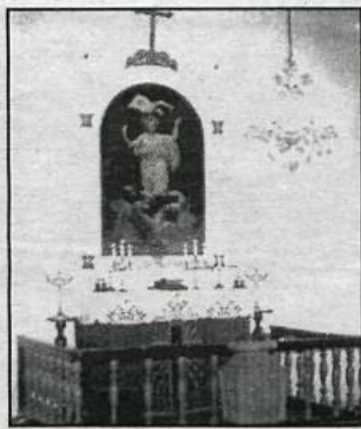
Altaristöfluna málaði Sigurður Guðmundsson.

þar var fyrsta kirkja sem mesta trúarskald Íslendinga Hallgrímur Pétursson þjónaði. Árið 1811 var Hvalsnesprestakall lagt niður og sóknin lögð undir Útskála.