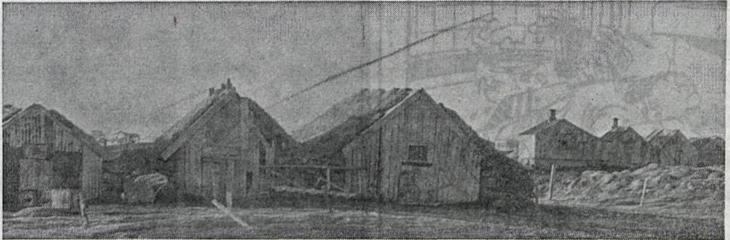
Gömul bæjarhús í Bjarskerjalandi.