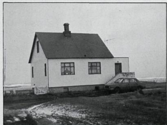
Bala á Stafnesi